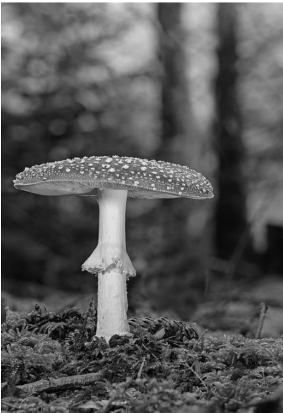
Fliegenpilz – Pilz des Jahres 2022

Auf eine erfolgreiche Pilzsaison und mit herzlichen Pilzgrüssen Catherine Müller (Juli 2022).