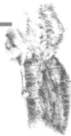
Zweckverband Forstrevier oberes Diegtertal